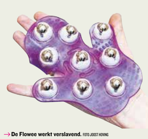
→ De Flowee werkt verslavend.

EIND OORDEEL ★ ★ ★ ★ ★ Hebbeding dat ontspanning biedt.