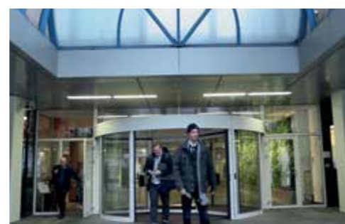
beeld pag. 13 - 14: still's uit video De Waterheuvél/Selby Stidemacher/PEKI, camera: Rogier Roeters