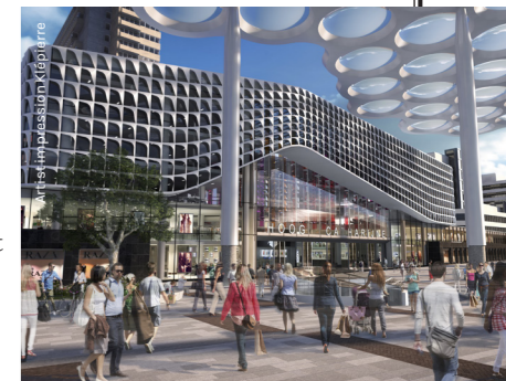
Boven: Hoog Catharijne in de jaren zeventig en onder een artist impression van de toekomst.